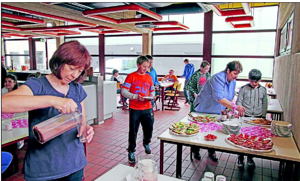
Gestärkt in den Unterricht: In der Hauptschule Niederpleis können Schüler dank Unterstützung der Nachbarschaftshilfe ihr Frühstück nachholen.

Vereins an die Stiftung übertragen. Ferner wurde der Betrieb der Nachbarschaftshilfe in Sankt Augustin in eine gemeinnützige GmbH überführt, mit deren Über-